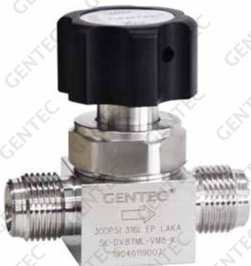
手动 300 psi

GENTEC® DV87 系列超高纯净膜片阀适用于半导体行业，可用于低压、大流量、超高纯净管路系统。