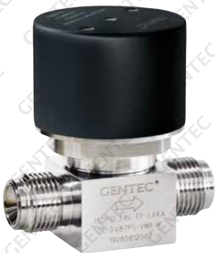
气动 150 psi